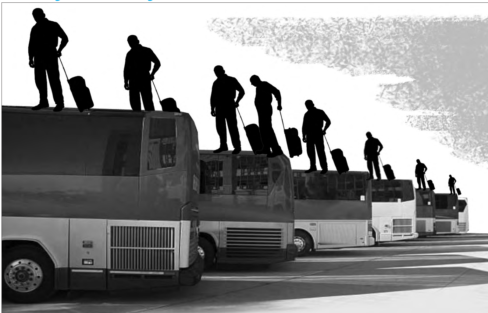
Колаж Олексія КУСТОВСЬКОГО.